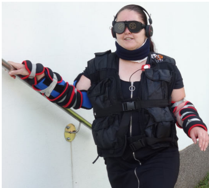
Foto ze školení zaměstnanců s názvem Gerontooblek a proměna stáří, který jsme realizovali v červenci 2021

Ještě jednu věc mám na srdci, o kterou se s Vámi chci svými očima i duší podělit. Mám i jistá zdravotní omezení a sama vychovávám dnes už 8letého syna. Od jeho nástupu do MŠ jsem vystřídala několik zaměstnání, protože časem bylo velmi složité až vysilující sladit zaměstnání s péčí o syna a se zdravotním stavem. Toto je prvním zaměstnáním, kde mi ani jednou narážkou nebylo vyčteno zdravotní omezení a ani jsem nebyla zaškatulkována do šuplíku: